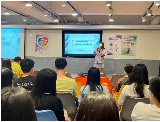
5/25 淡江大學 出席人數:42 人