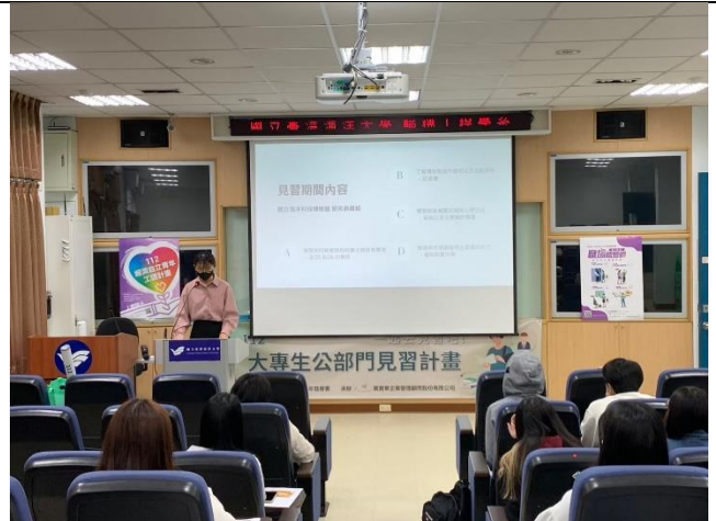
4/25 海洋大學 出席人數:19 人