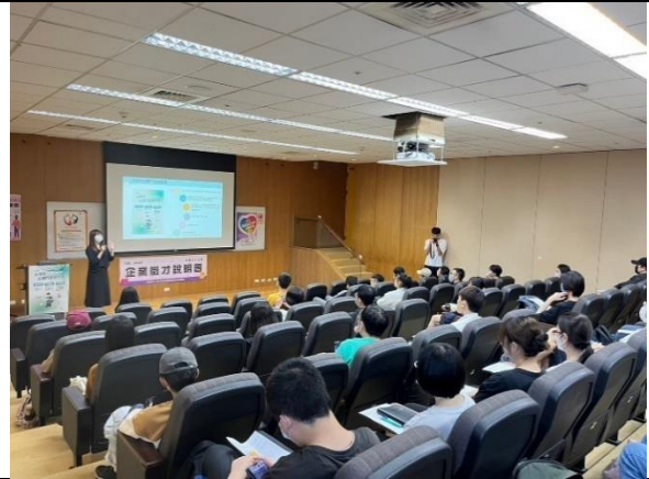
5/29 中國文化大學 出席人數:72 人