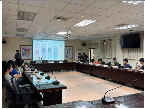
4/20 高雄師範大學 出席人數:15 人