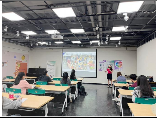
5/23 東吳大學(城中) 出席人數:20 人