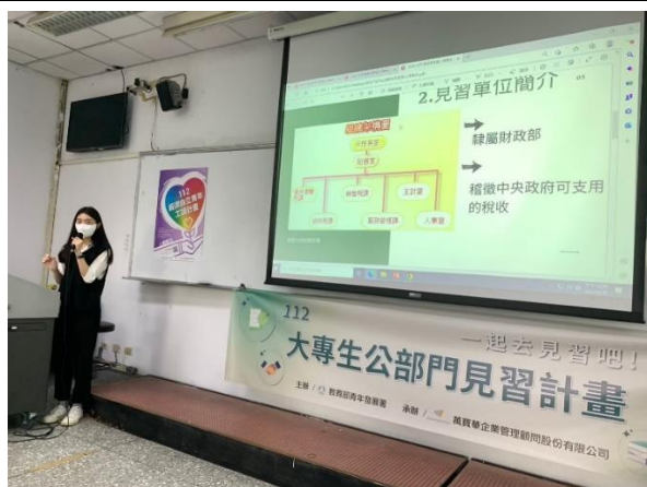
4/26 銘傳大學(桃園) 出席人數:43 人