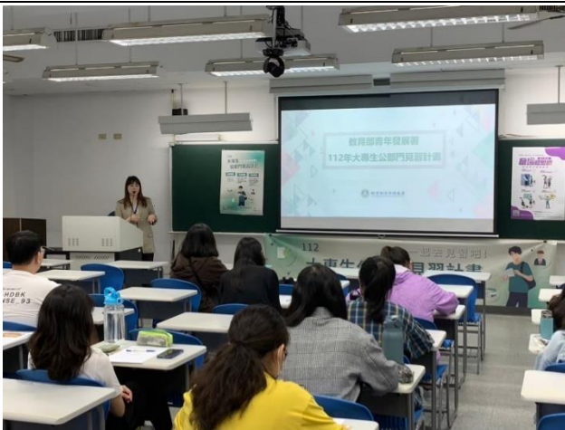
4/24 靜宜大學 出席人數:20 人