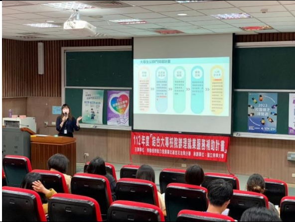
4/20 東華大學 出席人數:83 人