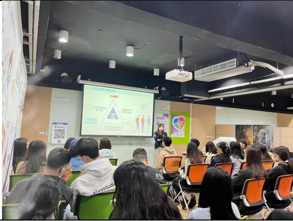
5/9 臺灣師範大學 出席人數:41 人