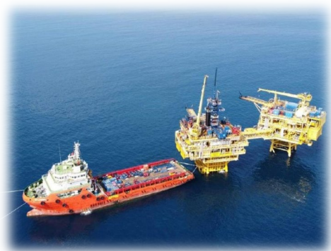
<< AHT / DP 多功能安錨船 >>