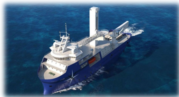
<< CSOV 風電運維母船 – 預計 2024 年來台 >>